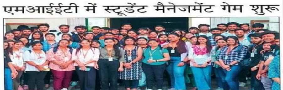
एमआईआईटी में शुरू हुई प्रतियोगिता में शामिल विद्यार्थी।